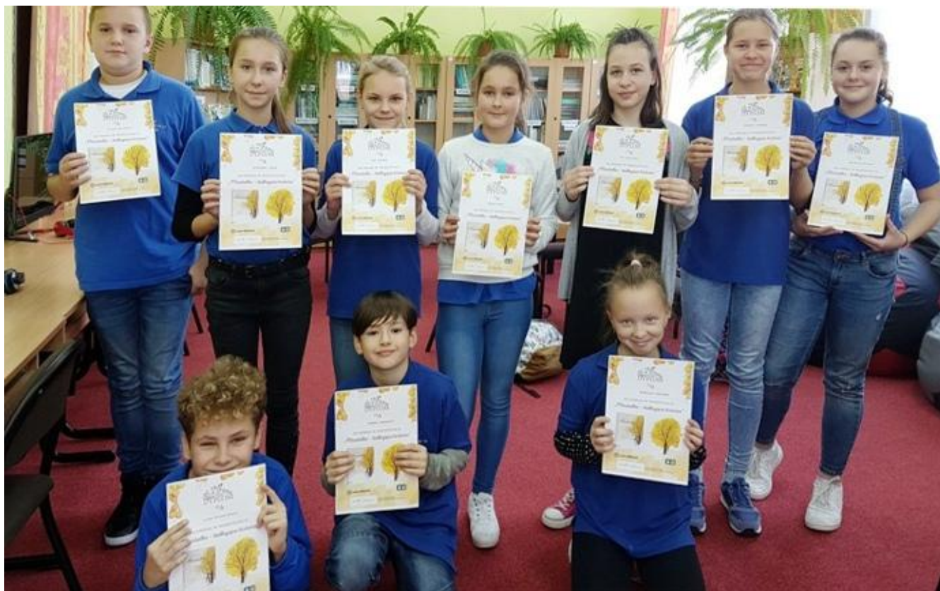
Wręczenie okolicznościowych dyplomów po zakończeniu warsztatów Mirabelka.