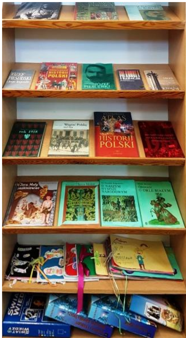
Niepodległościowa wystawa książek w bibliotece.

W listopadzie 2018 roku nauczyciele bibliotekarze przygotowali dwie nowe wystawy. Pierwsza zorganizowana została w bibliotece szkolnej i nosiła tytuł 100 lat Niepodległości . Znajdowały się na niej książki związane z tą tematyką.