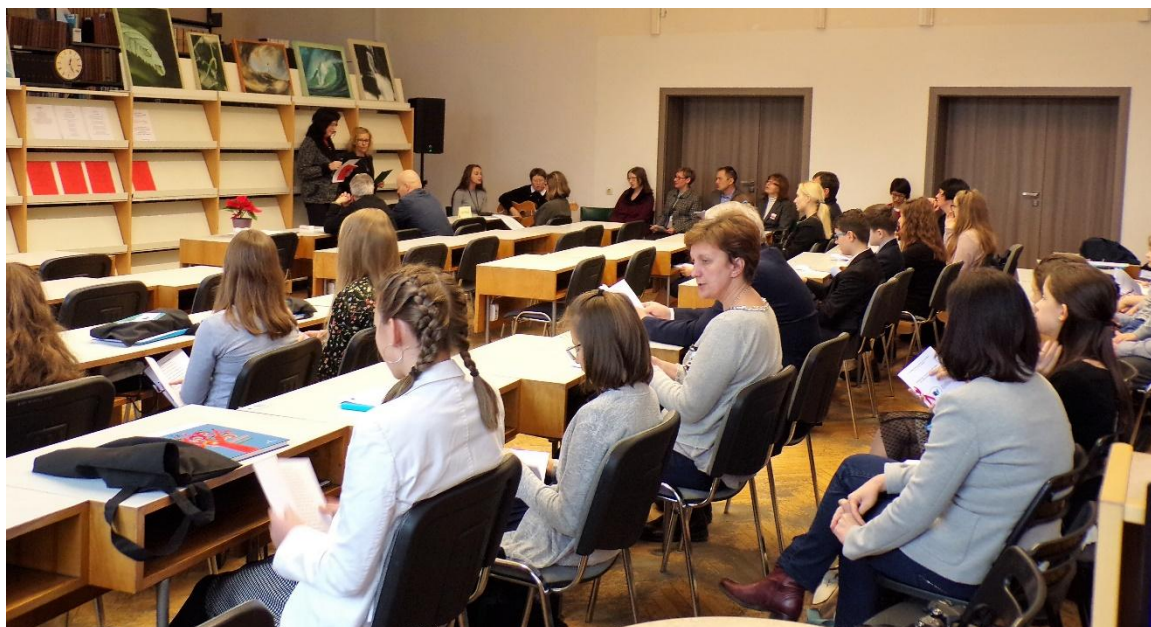
Finał Międzyfilialnego Konkursu Literackiego Ta, co nie zginęła .

To wydarzenie zwińczyło obchody roku Jubileuszu odzyskania przez Polskę Niepodległości w naszej Bibliotece.