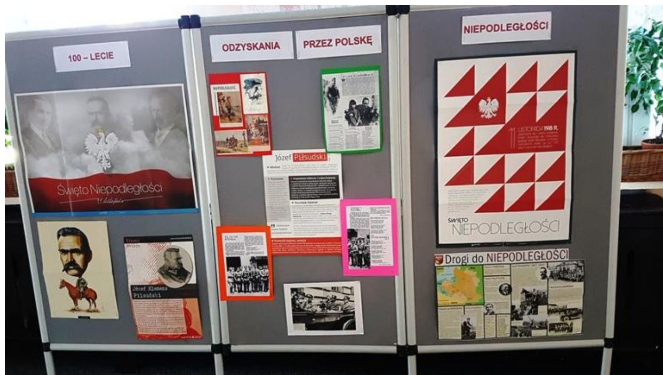
Wystawa plakatów z okazji 100-lecia odzyskania niepodległości w holu szkoły.

Druga wystawa zawierała okolicznościowe plakaty, zdjęcia i inne materiały poświęcone 100-leciu odzyskania przez Polskę niepodległości. Ta wystawa prezentowana była w holu szkoły.