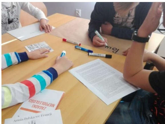
Tworzenie plakatu o Powstaniu Wielkopolskim.