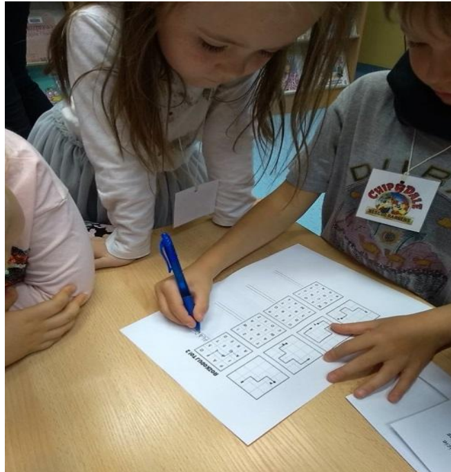
Rozwiązywanie zagadek z gry w „Labiryncie tajemnic biblioteki”.

na temat Polski, symboli narodowych naszej Ojczyzny oraz zabytków największych miast Polski. Gra toczyła się na trzech poziomach biblioteki, uczniowie zwiedzili czytelnię, wypożyczalnię, pracownię komputerową oraz magazyn biblioteczny, który jest istnym labiryntem. Dzięki temu, uczniowie mieli też okazję zapoznać się z biblioteką jako instytucją kultury, miejscem przyjaznym dla dzieci, wyposażonym w różne źródła wiedzy i informacji.