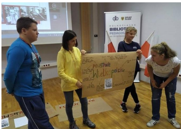
Prezentacja plakatów o Powstaniu Wielkopolskim.