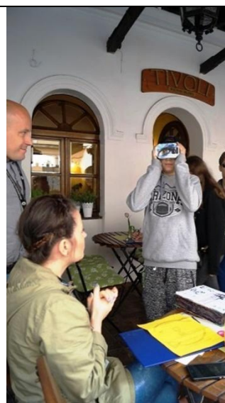
Wykorzystanie technologii 4D w grze miejskiej.