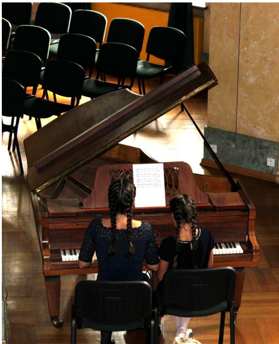
Koncert Niepodległej! .

Tematykę niepodległościową popularyzowano przez cały rok szkolny 2018/2019, organizując okolicznościowe ekspozycje i zajęcia biblioteczne. Przygotowano także materiały i publikacje, które były rozpowszechniane za pośrednictwem strony internetowej Biblioteki i Facebooka.