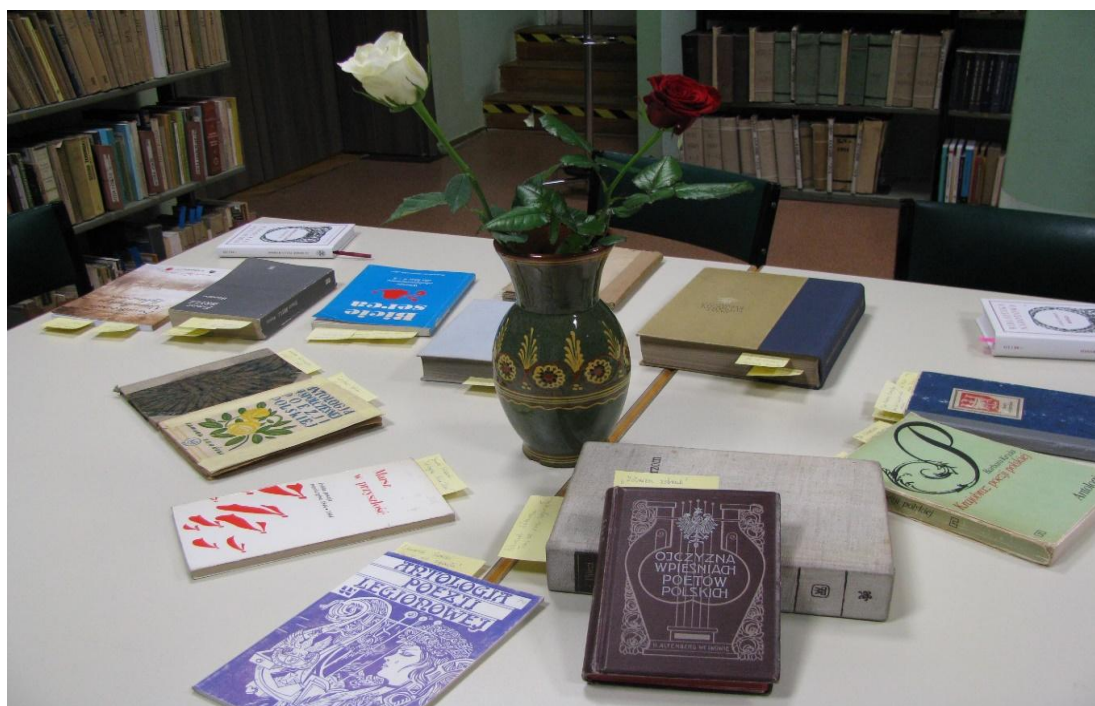
Wieczór poezji Poezja patriotyczna: inne spojrzenie.