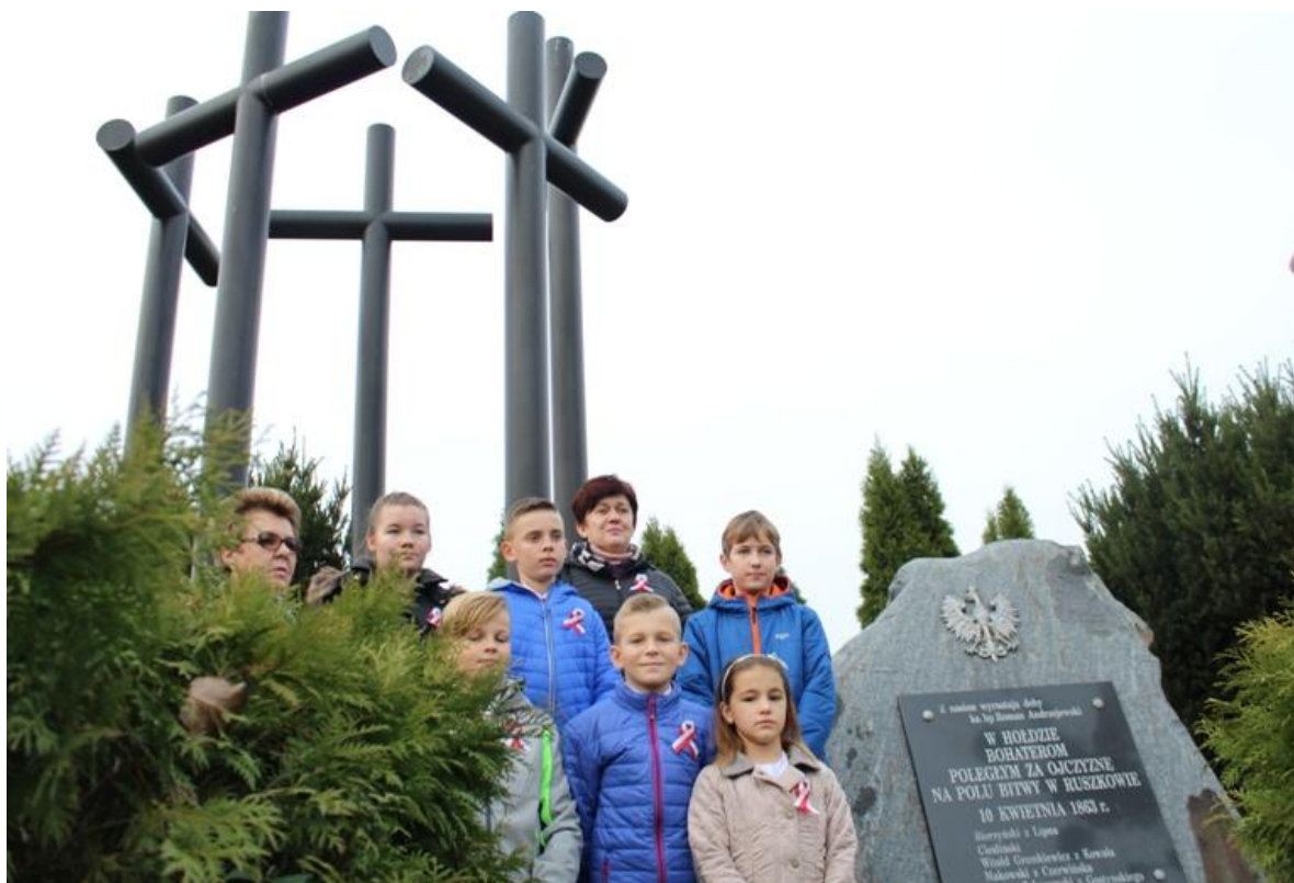
Przy Pomniku Powstańców Styczniowych w Ruszkowie.

Podjęte działania w 100-lecie odzyskania niepodległości wpisują się w realizację wychowania do wartości i kształtowania patriotycznych postaw uczniów. A najważniejsze jest ukształtowanie tożsamości narodowej – świadomości, że należymy do narodu polskiego. Pamięć o miejscach szczególnych deklaruje nasza szkolna społeczność, pamiętając i zapalając znicze przy Pomniku Powstańców Styczniowych w Ruszkowie.