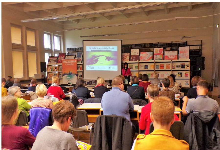
Konferencja W świecie wartości dziecka.