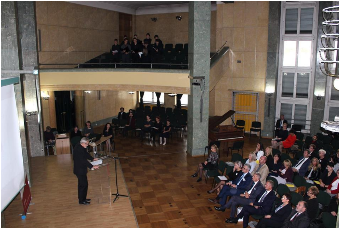
Koncert Niepodległej!.

W ramach obchodów 90-lecia Biblioteki ogłoszono dwa konkursy: grę jubileuszową „Czy wiesz, że...” oraz Internetowy konkurs wiedzy o Józefie Lompie . Laureaci obu konkursów wzięli udział w uroczystości oraz odebrali pamiątkowe dyplomy i nagrody. Z okazji jubileuszu wydano także okolicznościową publikację, zatytułowaną 90 lat Pedagogicznej Biblioteki Wojewódzkiej im. Józefa Lompy w Katowicach: 1928–2018 , którą rozdano przybyłym na uroczystość.