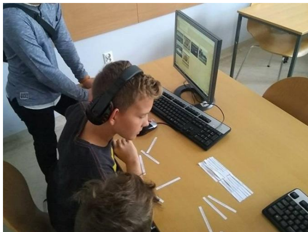
Układanie tekstu pieśni z zadania „Legiony”.