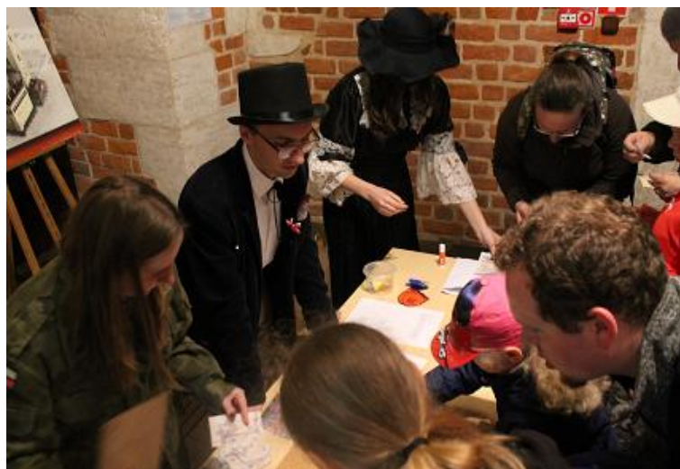
Kuryerzy Niepodległości. Gra miejska dla mieszkańców Krakowa.