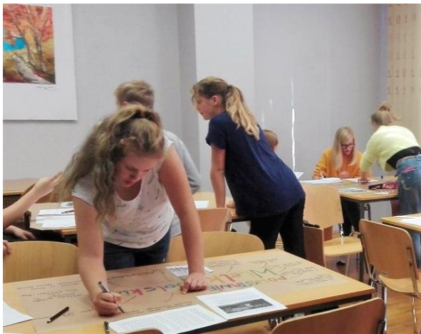
Tworzenie plakatów o Powstaniu Wielkopolskim.