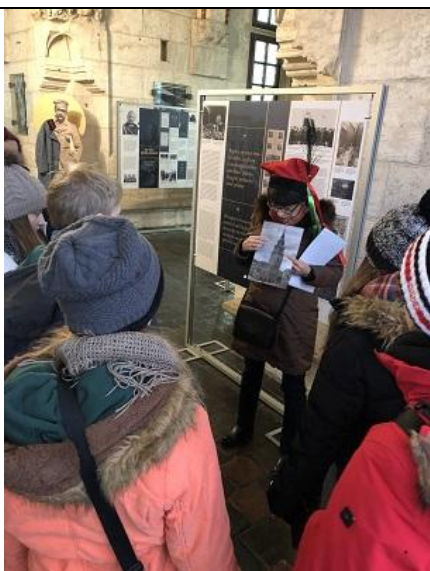
Odkrywamy tajemnice Krakowa. Gra miejska dla młodzieży Polonii amerykańskiej.