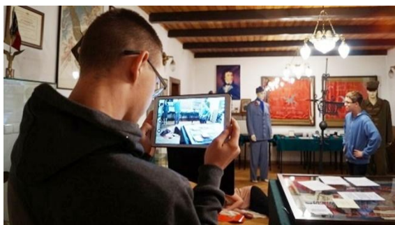
Inscenizacja posiedzenia sztabu wojskowego.

Pierwsza propozycja zajęć, adresowana do uczniów szkół podstawowych, poświęcona jest postaci Józefa Piłsudskiego i jego związków z Krakowem oraz historii legionów. Jak przeżyć I wojnę światową w Krakowie to z kolei okazja do poznania przez młodzież szkolną realiów życia mieszkańców Krakowa w latach 1914-1918 oraz historii sztuki tego okresu. Uczniowie muszą rozwiązać problem braku żywności, chorób panujących w mieście, zorganizować werbunek legionistów, zdobyć odwagę, ale mogą również odpocząć od trudów wojennych uczestnicząc w wystawach ekspresjonistów i narodzinach formizmu w sztuce. Punkty gry zorganizowane są w obiektach muzealnych, zabytkowych, pamiętających wydarzenia Wielkiej Wojny. Pomocą w poprawnym wykonaniu zadań służą materiały będące kopią ówczesnych dokumentów: kartki żywnościowe, obwieszczenia i reskrypty Urzędu Miasta Krakowa, zdjęcia ówczesnych szpitali wojskowych i artykuły Ilustrowanego Kuryera Codziennego .