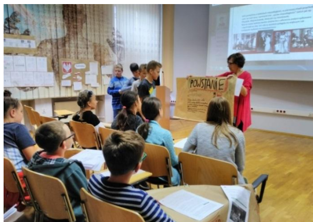
Prezentacja plakatów o Powstaniu Wielkopolskim.

Uczestnictwo w grze wywołało wiele pozytywnych emocji i wzruszeń, zwłaszcza podczas zadania dotyczącego pieśni patriotycznych. Uczniowie też szczególnie angażowali się w tworzenie plakatu, wykorzystując tu swoje zdolności plastyczne. Byli pod wrażeniem postaw i działań uczestników Powstania Wielkopolskiego oraz najmłodszych uczestników walk o Lwów. Wyjątkowo podobały im się zadania w formie interaktywnych quizów.