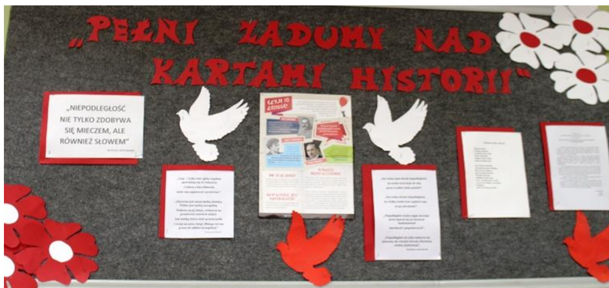
Gazetka przygotowana w bibliotece szkolnej z okazji 100-lecia odzyskania niepodległości.

Rok 2018 został ogłoszony Rokiem Jubileuszu 100-lecia Odzyskania przez Polskę Niepodległości. Rocznicą ta była także wpisana w jeden z głównych kierunków realizacji polityki oświatowej państwa w roku szkolnym 2018/2019 – wychowania do wartości i kształtowania patriotycznych postaw uczniów .