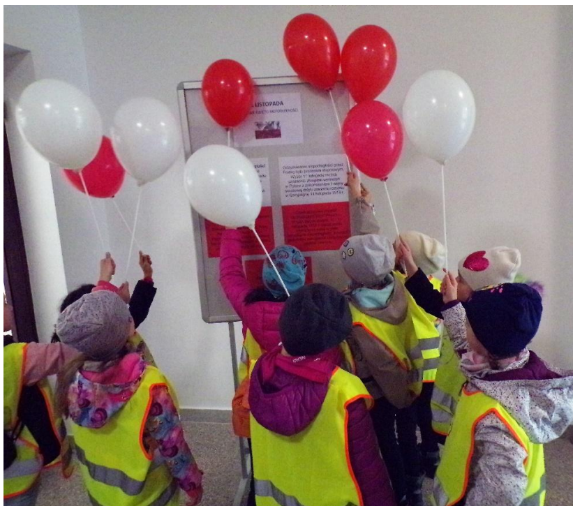
Warsztaty Edukacja patriotyczna .

Na szczególną uwagę zasługują warsztaty pod nazwą Edukacja patriotyczna poświęcone polskim symbolom narodowym, jakimi są godło, flaga i hymn. W czasie zajęć prezentowano film edukacyjny, dyskutowano o historii naszego kraju, układano puzzle tematyczne, a na zakończenie tworzone i ilustrowano książki do wybranego wiersza polskiego poety.