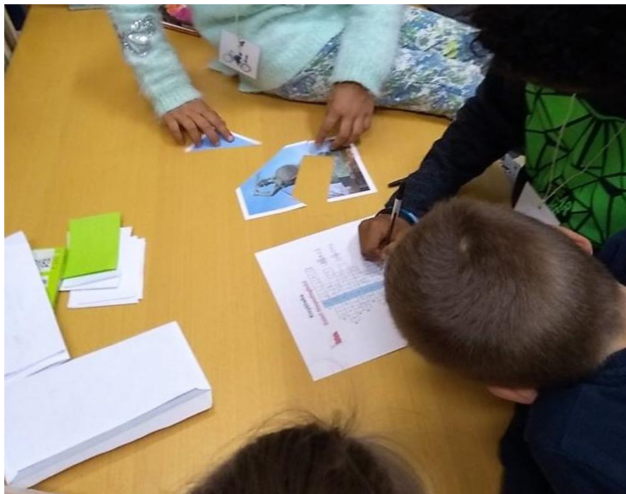
Rozwiązywanie zadań z gry w „Labirynt tajemnic biblioteki”.

Na zakończenie każda z grup przedstawiała stworzone przez siebie plakaty i opisywała wydarzenia z Powstania Wielkopolskiego, które na nich umieściła, a następnie przedstawiała wybrane przez siebie wydarzenia i osiągnięcia z okresu międzywojennego, opierając się na danych z zadania „Alfabet Niepodległości”.