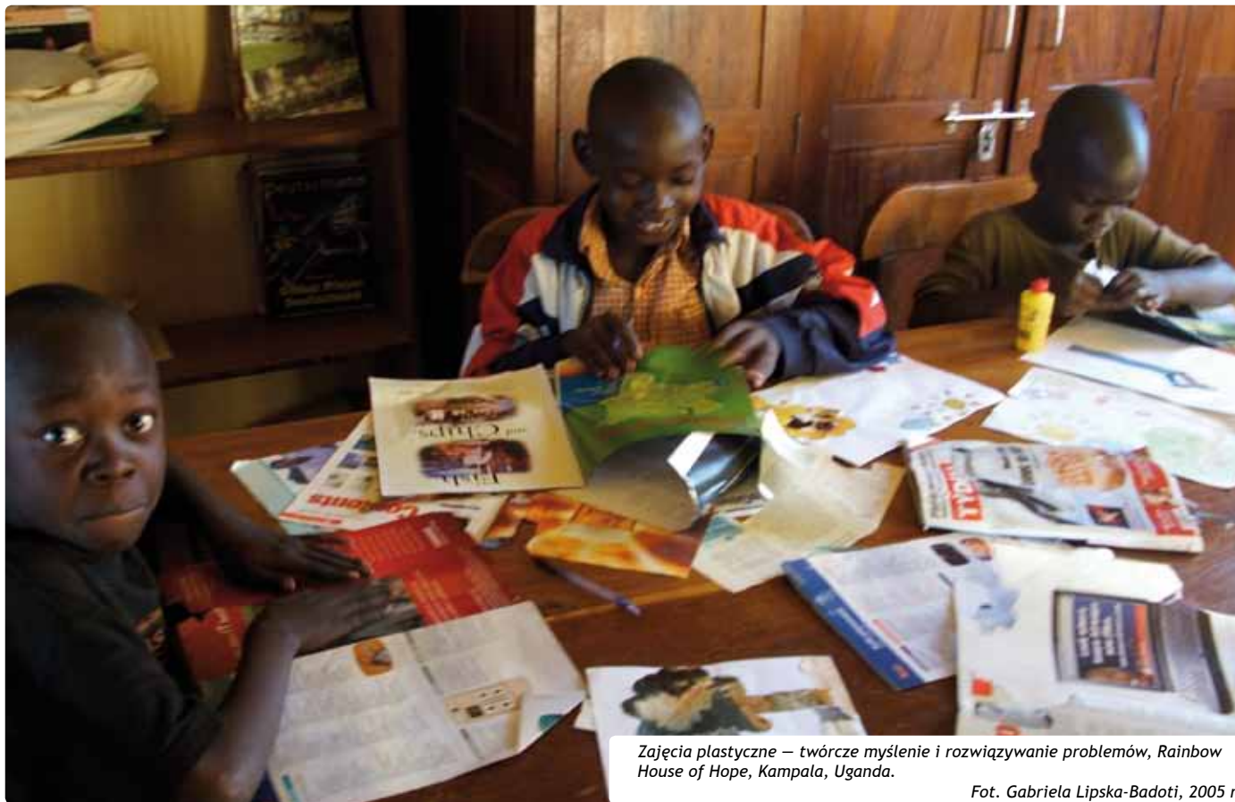
Zajęcia plastyczne – twórcze myślenie i rozwiązywanie problemów, Rainbow House of Hope, Kampala, Uganda.