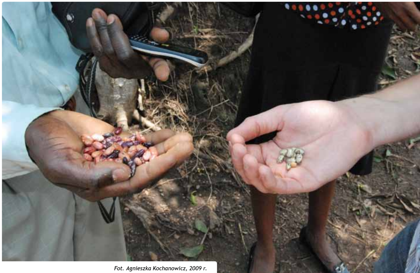
Fot. Agnieszka Kochanowicz, 2009 r.