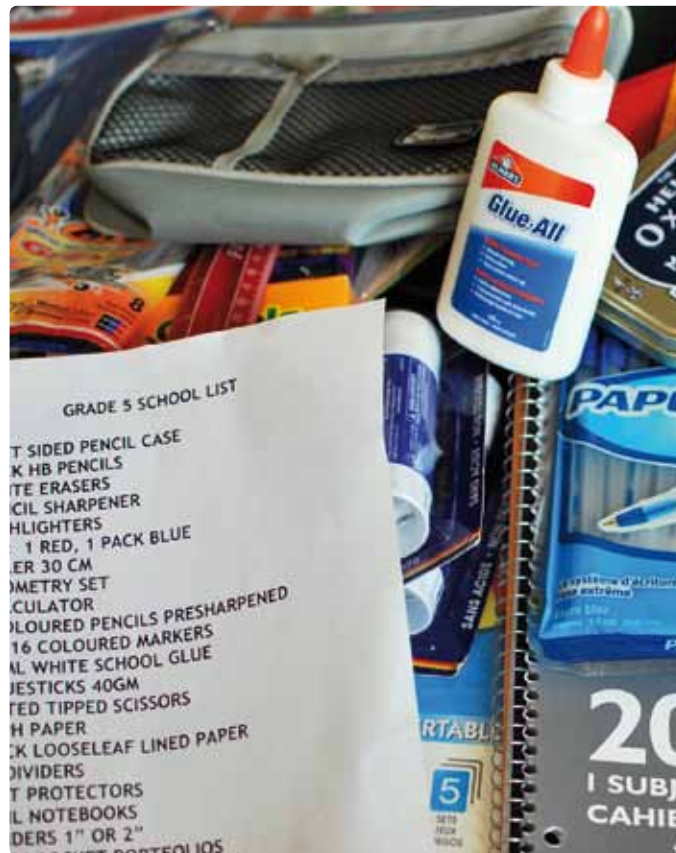
Fot. Meddygarnet/Flickr, www.flickr.com/people/meddygarnet

Źródło: Agnieszka Mikina, Bożena Zajac, Metoda projektów w gimnazjum. Poradnik dla nauczycieli i dyrektorów gimnazjum, Ośrodek Rozwoju Edukacji, Warszawa 2010.