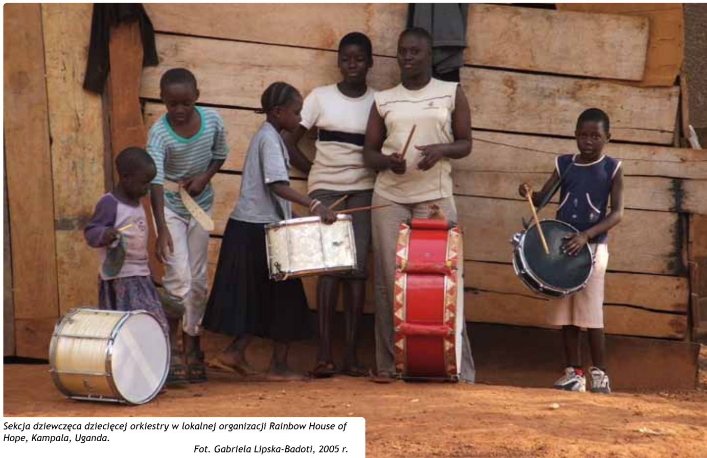
Sekcja dziewczęca dziecięcej orkiestry w lokalnej organizacji Rainbow House of Hope, Kampala, Uganda.